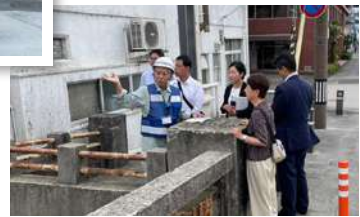
舞鶴市・高野川の 総合的な治水対策についての現地視察